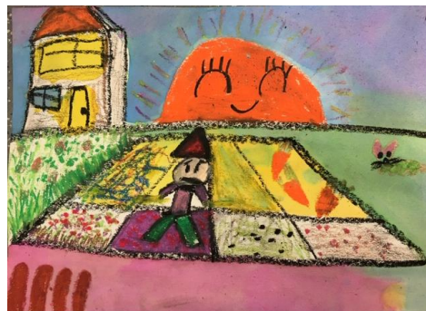
Een echte van Gogh en werk van een leerling